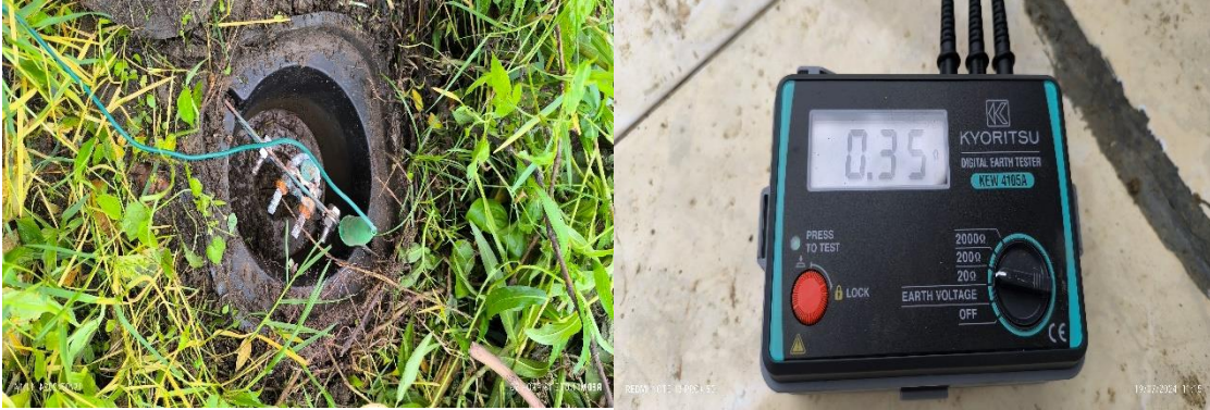
Hasil Pengukuran Menunjukkan Angka 0.35 \Omega