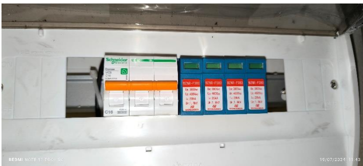
Arrester Menunjukkan Warna Hijau